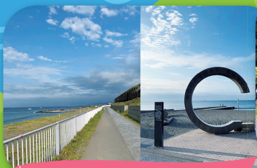
サイクリングロード／サザンビーチ

ウォーキングは、いつでも、どこでも、誰にでもできる体に優しい有酸素運動。健康維持やダイエット… 100キロウォークにチャレンジしてみませんか。しかも楽しくウォーキングしながら神奈川を再発見！ 是非ご家族そろってご参加ください！！