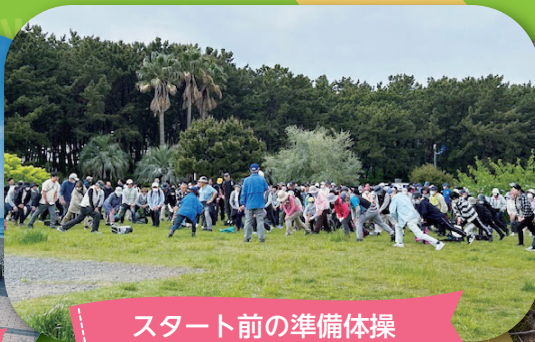
スタート前の準備体操