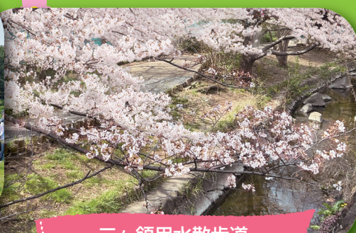
二ヶ領用水散歩道