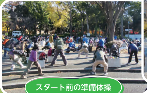
スタート前の準備体操