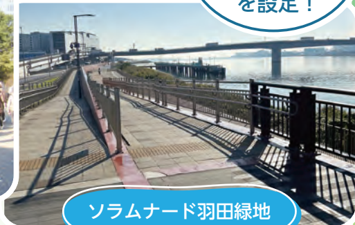
ソラムナード羽田緑地